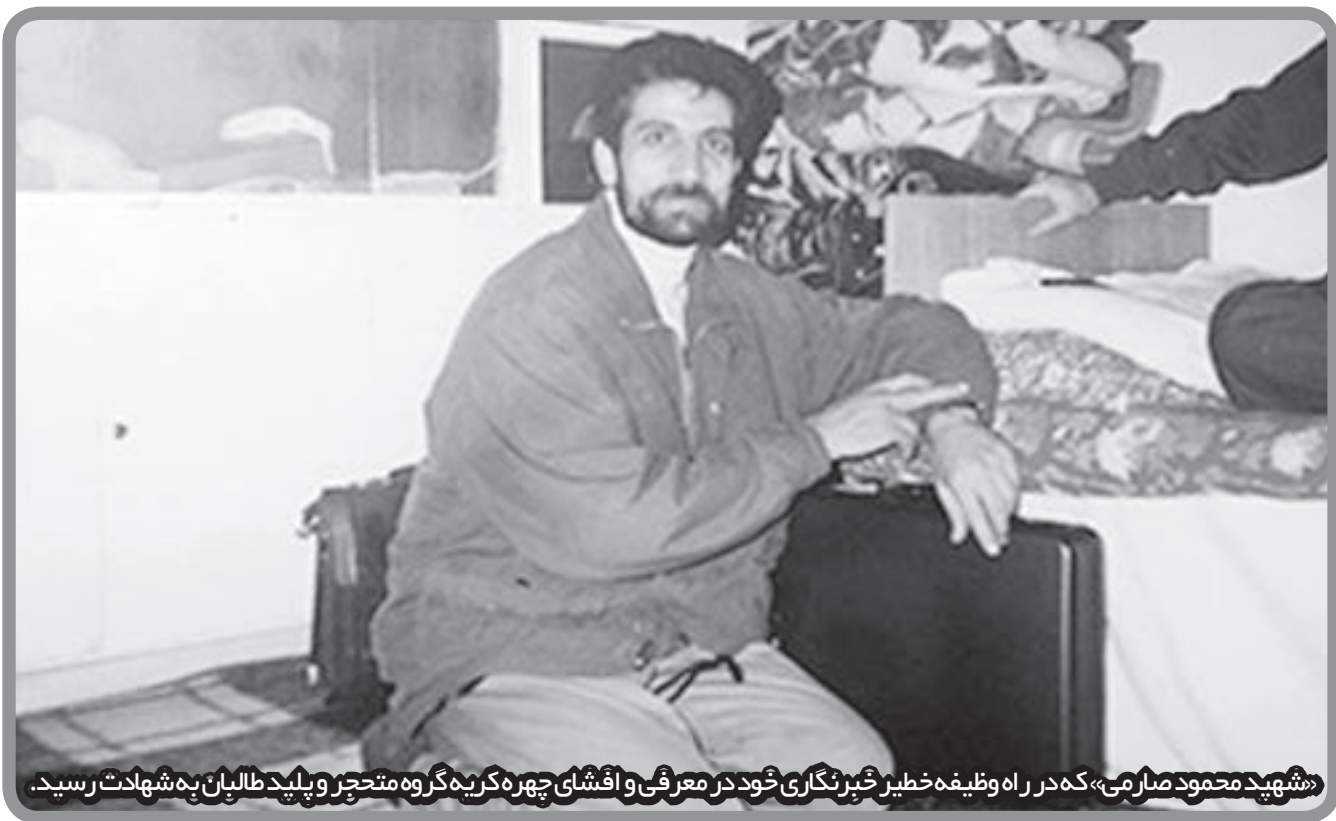
«شهید محمود صرامی» که در راه وظیفه‌خیز خبرنگاری خود در معرفی و افشای چهره‌گره متحجر و پیلدطلبان به شهادت رسید.