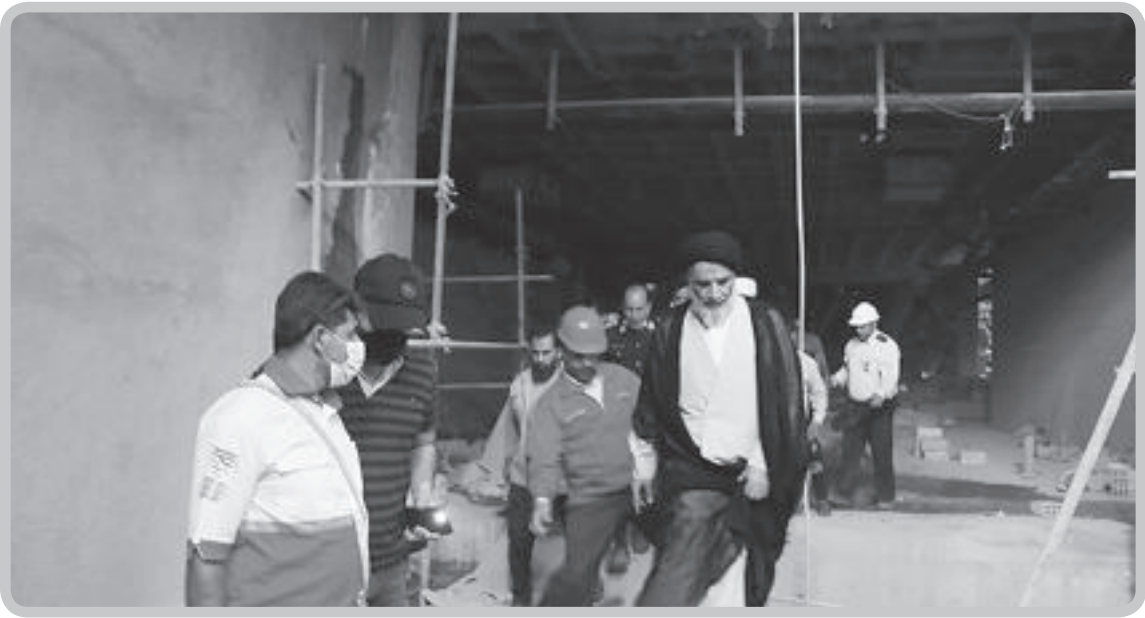
حضور امام جمعه یزد در مراسم افتتاحیه جشنواره رسانه و عدلیه استان یزد

عصرایران؛ مصطفی داننده- در این مدت انتقادهای زیادی از خطبه‌های ائمه جمعه کشور به ویژه تهران و مشهد داشته‌ام و می‌خواهم در این نوشتار از رفتار یک امام جمعه تقدیر کنم. حجت‌الاسلام والمسلمین سید عبدالنبی موسوی‌فرد امام جمعه اهواز، دقیقاً و بزرگی‌های یک امام جمعه را دارد و به جای اینکه نماینده رسمی قدرت شناخته شود کنار مردم ایستاده و از آنها می‌گوید. او در جنوبی‌ترین نقطه اهواز زندگی می‌کند؛ وقتی به آیین مقام منصوب شد، اسباب و اثاثیه زندگی‌شان را جمع و به منطقه «آخر آسفالت» اهواز رفت تا در کنار ضعیف‌ترین مردمان زیست کند. در ماجرای «متروپل» آبادان هم به سرعت در صحنه حاضر شد و قبا و عبا را کنار گذاشت و به دل حادثه زد. خطبه او در مورد حادثه آبادان را بخوانید: «موضوع دیگر این است که مسئولان وقتی