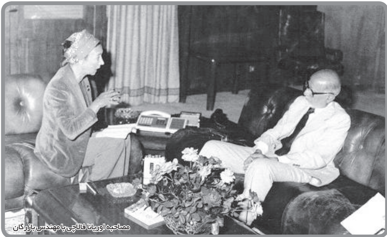
مصاحبه اوریانا فالاجی با مهندس بازرگان