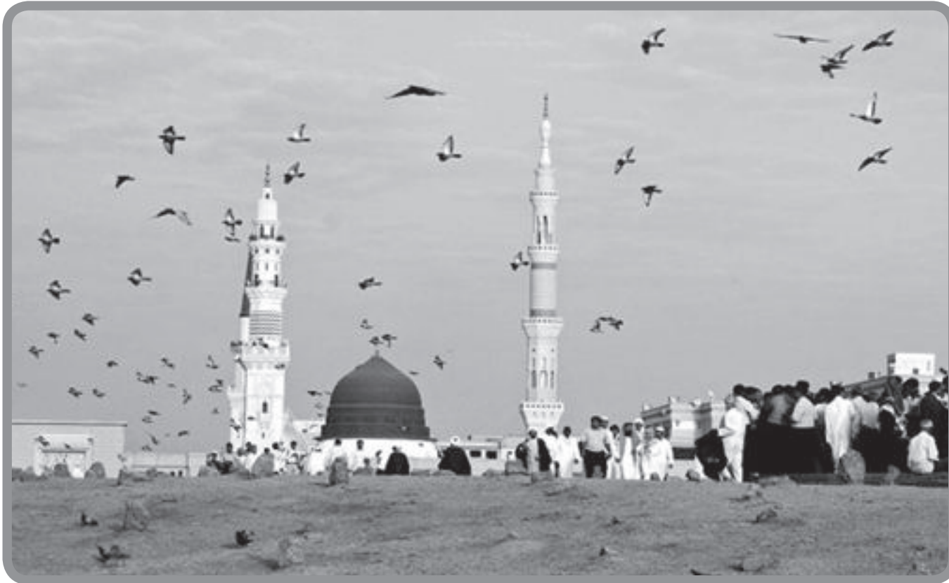
شهید آیت ا... بهشتی: اگر به راستی میسر بود که این‌گونه اختلافات جزئی در میان مسلمانان برطرف شود که همه یک روز را به‌عنوان میلاد پیغمبر (ص) جشن بگیرند و همه یک روز را به‌عنوان وفات پیغمبر (ص) سوگواری کنند، بسیار بهتر بود.