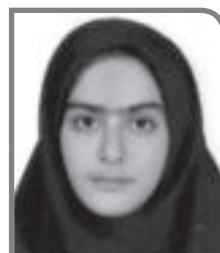
نیایش دشتی هفتم - تصویرسازی پنجم ناحیه