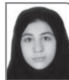
یاس قمی یازدهم انسانی - داستان نویسی سوم ناحیه